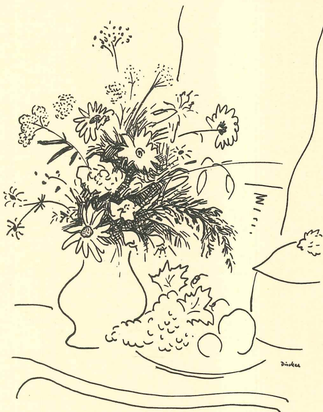
DIBUJO DE JORGE DISDIER

Delegación de Cultura del Ayuntamiento de Marbella