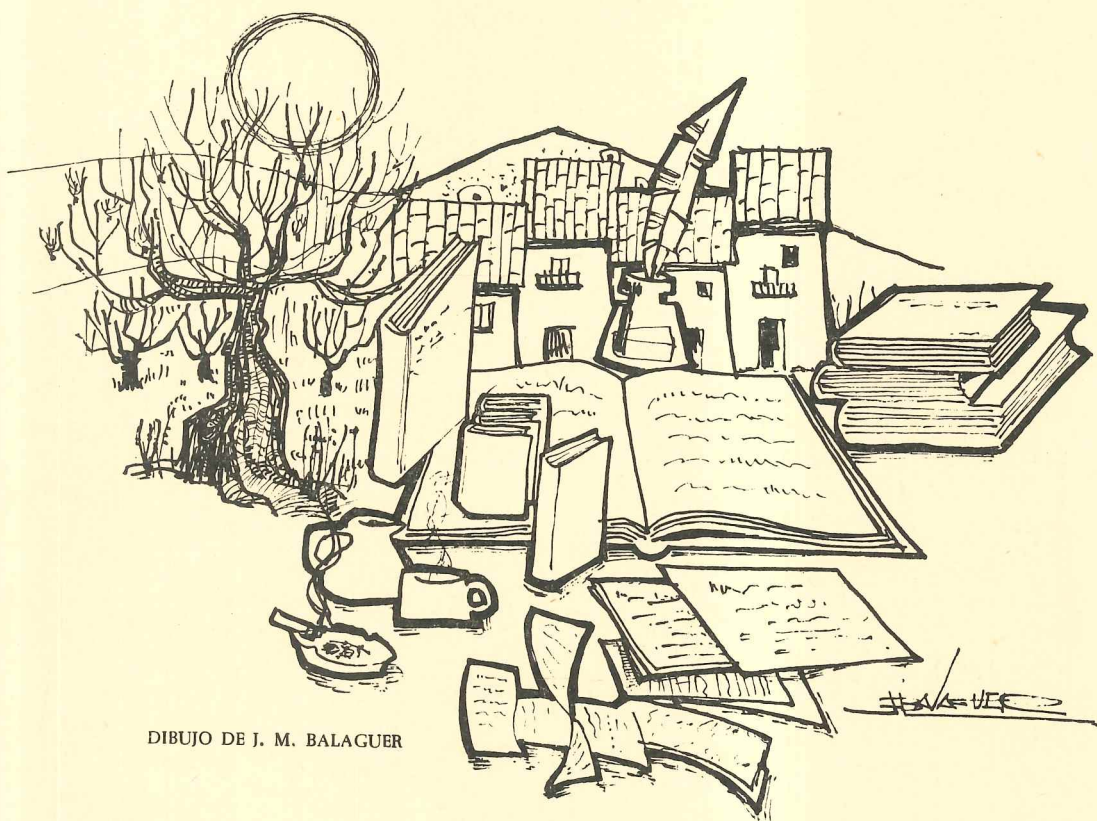
DIBUJO DE J. M. BALAGUER

Delegación de Cultura del Ayuntamiento de Marbella