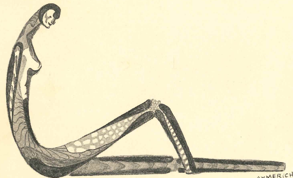
DIBUJO DE AYMERICH

DELEGACION DE CULTURA DEL AYUNTAMIENTO DE MARBELLA