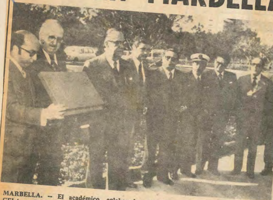
MARBELLA. -- El académico, colaborador de ULTIMA HORA, CAMILO JOSE CELA recibe la placa conmemorativa de la calle que le ha dedicado el Ayuntamiento de Marbella. Cela se encuentra en Marbella como miembro del Jurado del Premio de Novela Ciudad de Marbella.

AGENCIA INTERNACIONAL CAMARASA Reyes Magos, 22 - MADRID (7)