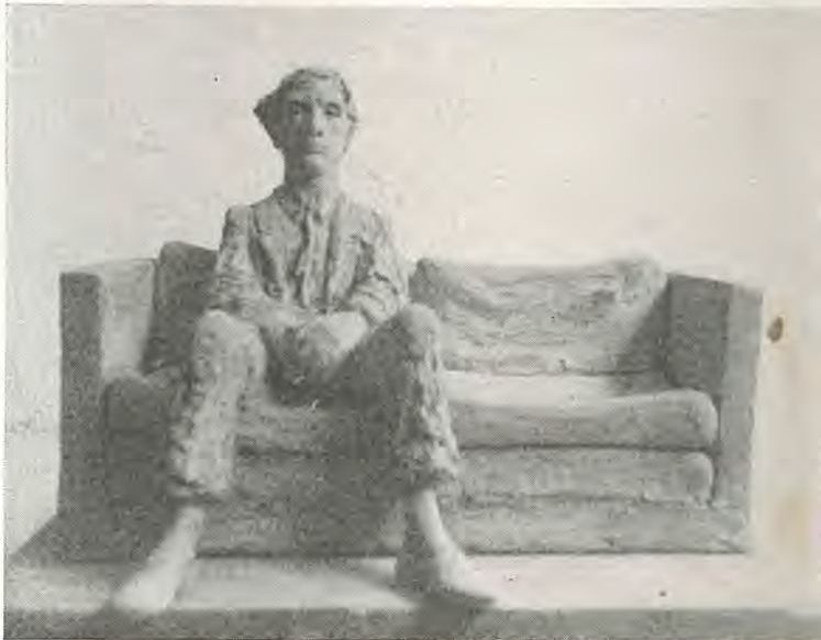
VERSOS PARA ENTRETENER AL «HOMBRE SENTADO», DE RAMON MURIEDAS

Una ambigüedad intencional nos ofrece situado el modelo bajo un estado en el que toda precisión demasiado verídica parece deslizarse en seguida hacia la fantasía pura o la ensoñación.