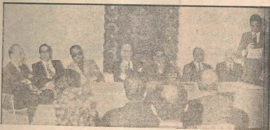
Un aspecto de la mesa del jurado del IV Premio de Novela Ciudad de Marbella, presidiendo por don Camilo José Cela

MARBELLA. (De nuestra Redacción.) — El pasado domingo, día 7, a las ocho de la tarde, tuvo lugar en el salón de exposiciones de la Bienal, instalado en el nuevo Palacio Municipal de la plaza del Generalísimo, el acto por el cual se dio a conocer el fallo del IV Premio de Novela Ciudad de Marbella.