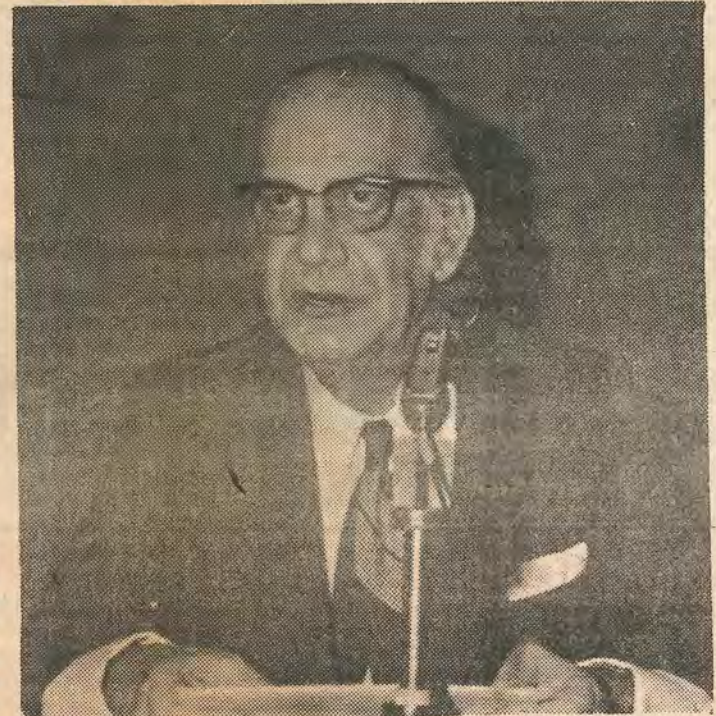
El escritor y académico don Camilo José Cela, presidente del Jurado del "IV Premio de Novela Ciudad de Marbella".

—El primer premio fue hace cuatro años. Se hizo con mucha ilusión, con la idea de ampliar las actividades culturales en nuestra ciudad y de que los mayores y muchachos pudieran ver en su ciudad a escritores que conocían a través de los libros. Ese es el motivo por el cual, cada año hacemos que los personajes del Jurado sean en parte distintos. El primer