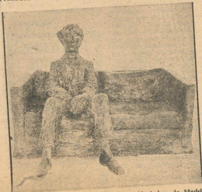
Premio de escultura. Obra de Ramón Muriedas, de Madrid

Nuestra felicitación al Ayuntamiento de Marbella y muy especialmente a los señores Cantos y Vallés, por el éxito de esta III Bienal Internacional de Arte, que alcanza cada dos años más altas cotas..