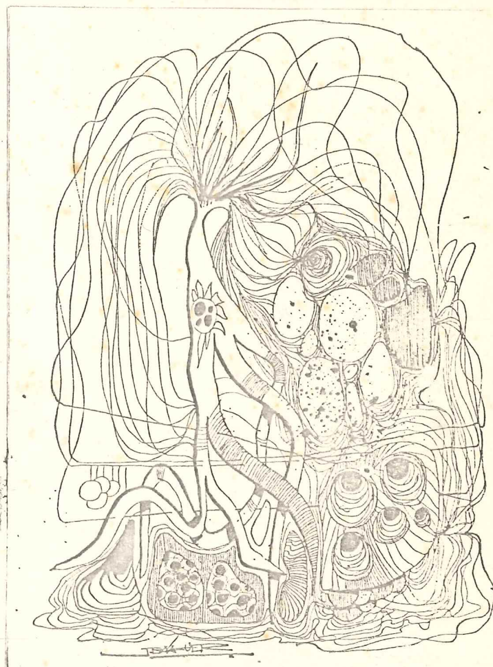
DIBUJO DE J. M. BALAGUER

DELEGACION DE CULTURA DEL AYUNTAMIENTO DE MARBELLA