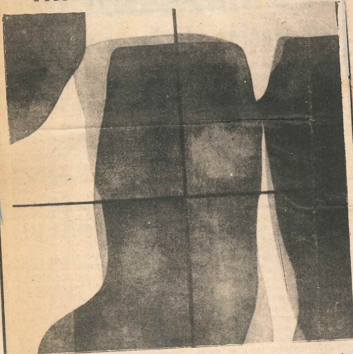
Premio de la III Bienal de Arte de Marbella. Obra de Josefa Caballero de Málaga.

El pasado día 18 se hizo público el fallo de la III Bienal de Arte de Marbella. Recordamos a nuestros lectores que podían tomar parte todos los pintores y escultores, españoles o extranjeros, con un máximo de dos obras por autor y teniendo como base un tema a libre elección del autor.