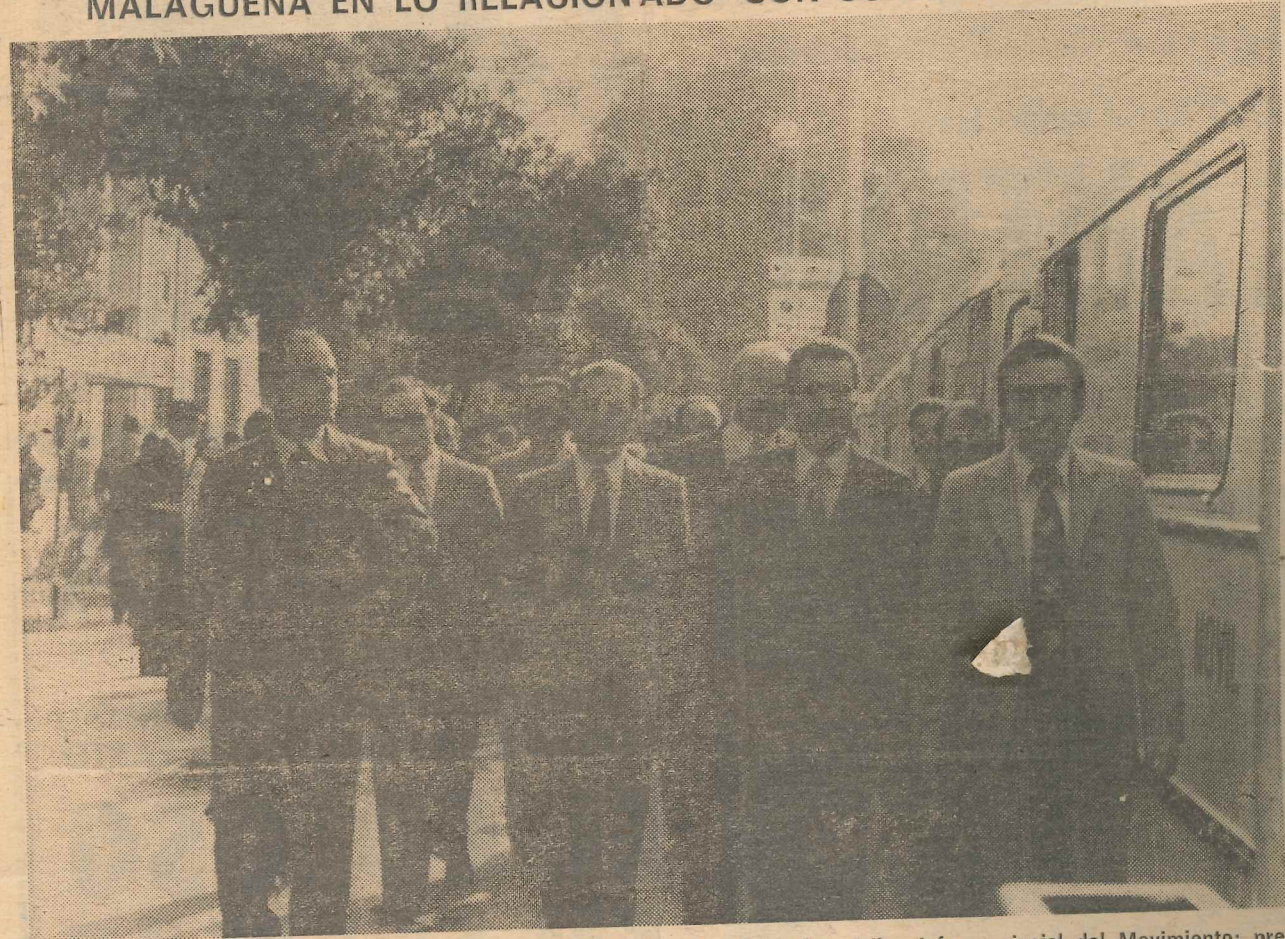
El director general del Patrimonio Artístico y Cultural, con el gobernador civil y jefe provincial del Movimiento; presidente de la Diputación y otras autoridades y representaciones, en la acera de la plaza de Queipo de Llano en su recorrido junto a los bibliobuses.