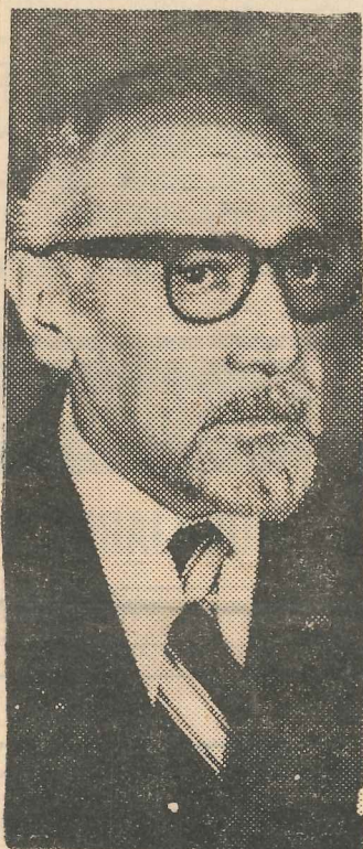
RAMON J. SENDER QUIERE VENIR A ESPAÑA